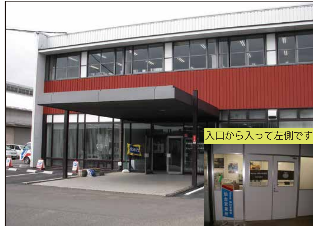
本社及び仙台営業所 写真